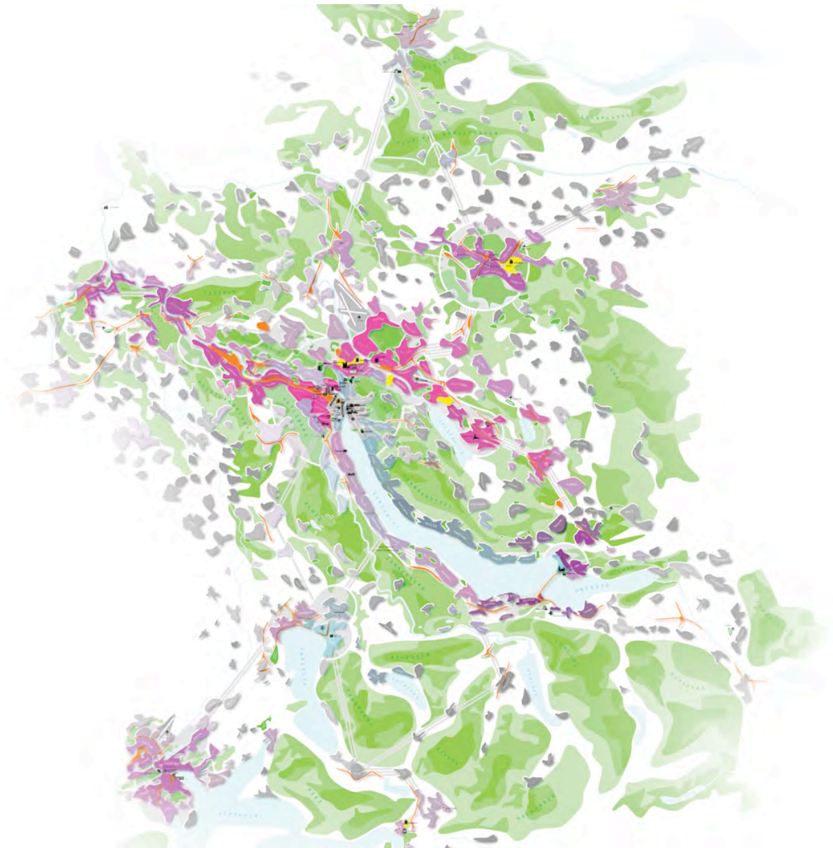
Abbildung 3: Metrobild als vielfältiges Standortmosaik

Das Bild des Metropolitanraumes Zürich zeigt das vielfältige Standortmosaik der Region. Gebiete mit hoher Kapazität leuchten rot, während Orte mit geringer Kapazität blau angelegt sind. Die Graustufen zeigen das Veränderungspotenzial, je dunkler desto gefestigter und nicht mehr änderbar ist ein Standort. Das Zentrum von Zürich ist dunkelgrau, während Limmat- und Glattal rot hervorstechen. Die verschiedenen Teile des Standortmosaiks hängen aber voneinander ab. Nur gemeinsam wird die Standortqualität erreicht. Wie in einer ökologisch reichhaltigen Wiese ist Vielfalt ein Wert an sich, da damit Zukunftsfähigkeit erreicht wird. Eine zukunftsgerichtete Strategie muss dieses Standortmosaik in seinen Facetten weiterführen, Zonen hoher Kapazität verdichten und Freiräume bewahren. Lokale Identitäten sollen verstärkt werden.