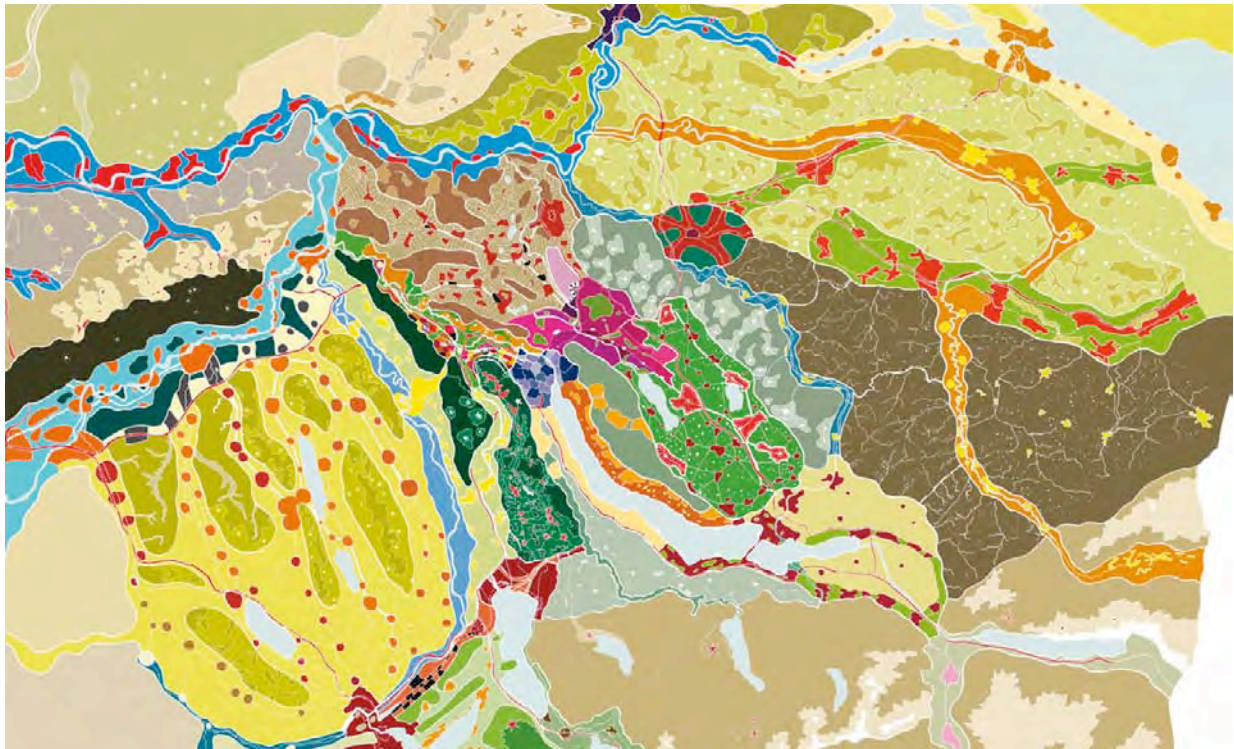
Abbildung 1: Metrobild identifiziert Teilräume

Die räumliche Vielfalt des Metroriums ist eine der herausragenden Qualitäten des Metroriums: Teilräume mit unterschiedlichsten Charakteren liegen dicht beieinander. Diese Vielfalt in all ihren Facetten wird weiterentwickelt und in einem Zukunftsbild der Region sichtbar gemacht. Das Metrobild zeigt die wesentlichen zukünftigen Merkmale der Region.